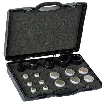
Für Face und Body

Bereits nach der ersten Behandlung sind oft beeindruckende Ergebnisse sichtbar. Medizinische Studien bestätigen die tiefenwirksame Wirkung der eingespeisten Wirkstoffe und die langfristige Verbesserung des Hautbildes. Die Behandlung dauert etwa 20 – 30 Minuten, und nach 4 bis 6 Anwendungen werden optimale Ergebnisse erzielt.